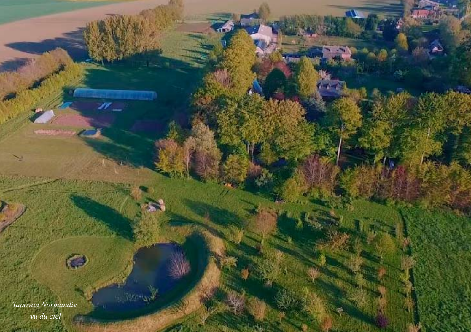
Tapovan Normandie vu du ciel