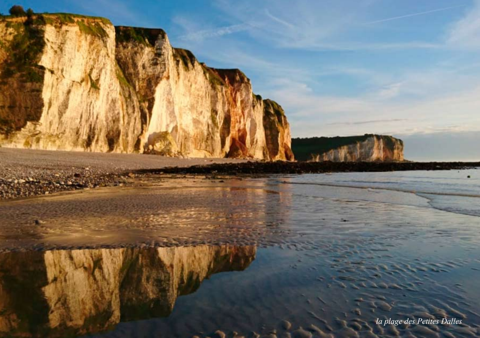
la plage des Petites Dalles