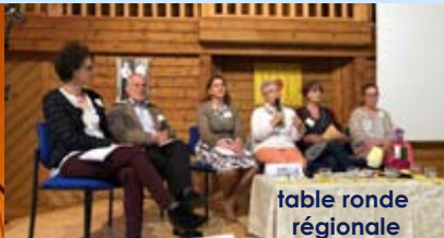
table ronde régionale