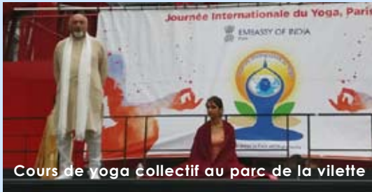
Cours de yoga collectif au parc de la vilette