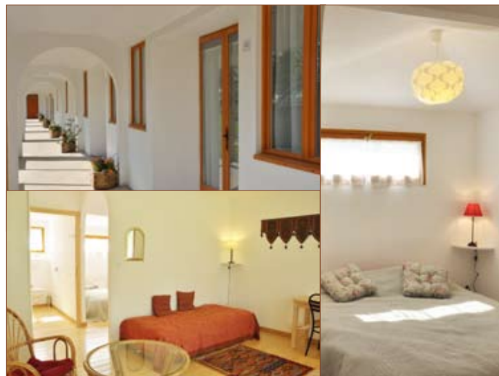
Studios Surya (catégorie supérieure)

. toute semaine de cure, formation ou stage commencée est dûe dans son intégralité (sauf avis médical).